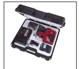
Levereras i plastväska.