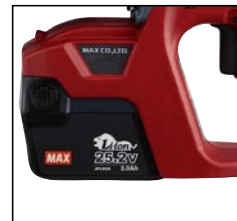
176 klipp per laddning (16 mm).