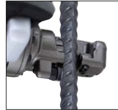
Klipper 16 mm järn på 3,3 sek och fullbordar en hel cykel på 5–5,5 sek.