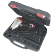
Levereras i plastväska.